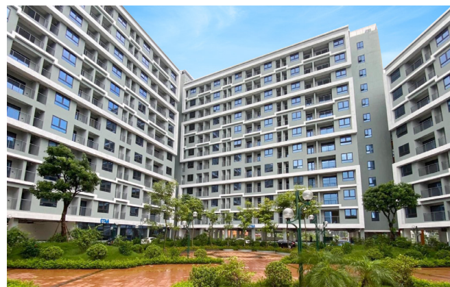
Nhà ở xã hội Khu đô thị Kim Chung

15 KHU CÔNG NGHIỆP 14 Khu công nghiệp 01 Khu kinh tế