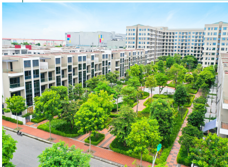
Nhà ở dành cho chuyên gia và công nhân Khu công nghiệp Yên Phong