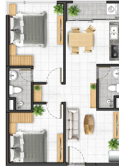
Căn hộ 2 phòng ngủ 54 m 2