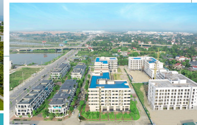
Nhà ở dành cho chuyên gia và công nhân Khu công nghiệp Phú Hà