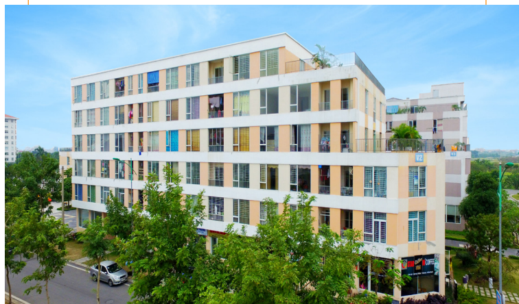
Nhà ở xã hội Khu đô thị Đặng Xá