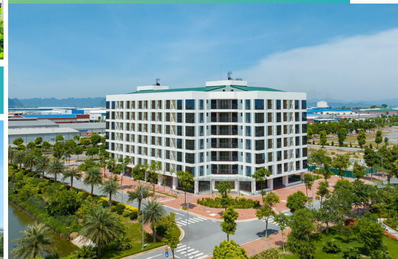
Nhà ở dành cho chuyên gia và công nhân Khu công nghiệp Đồng Văn IV