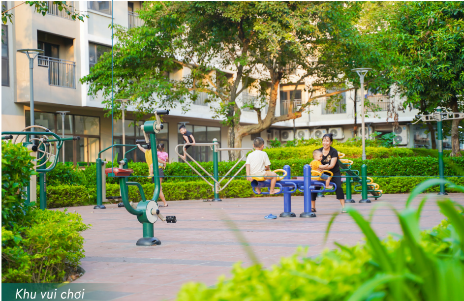
Khu vui chơi