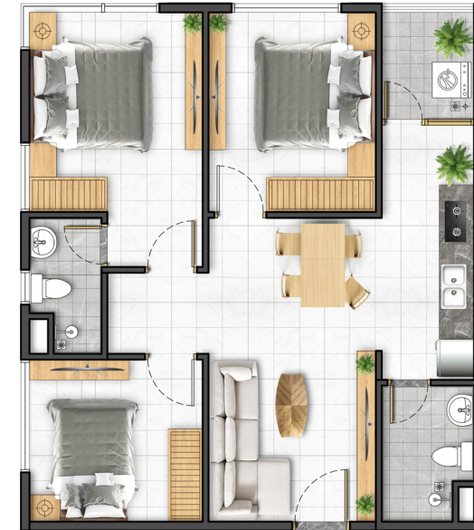
Căn hộ 3 phòng ngủ 67,8 m 2