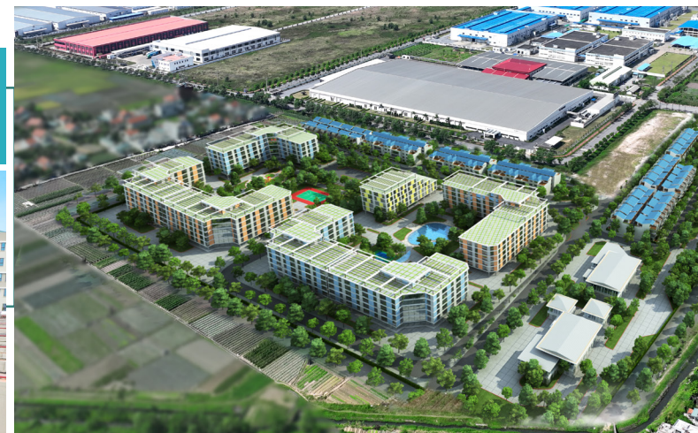
Nhà ở dành cho chuyên gia và công nhân Khu công nghiệp Đông Mai