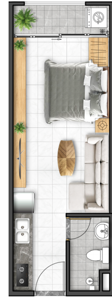
Căn hộ 1 phòng ngủ 26,4 m 2