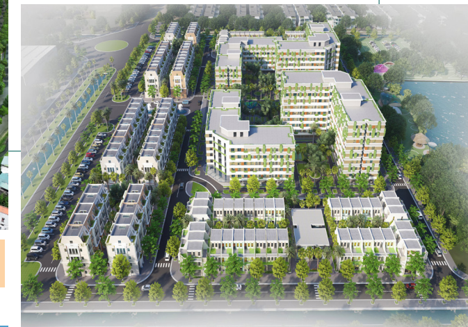
Nhà ở dành cho chuyên gia và công nhân Khu công nghiệp Tiên Hải