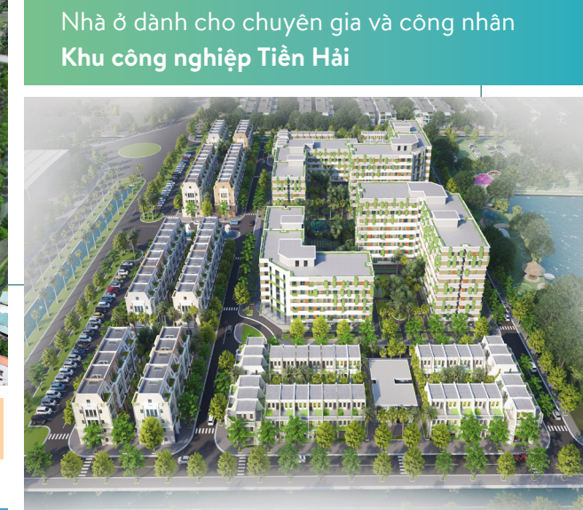
Nhà ở dành cho chuyên gia và công nhân Khu công nghiệp Tiên Hải